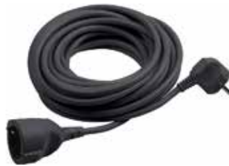
Stromanschluss Schuko 230V / 10A