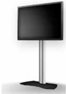
55" Screen auf Standfuß