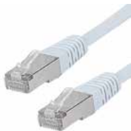
Netzwerkanschluss am Stand